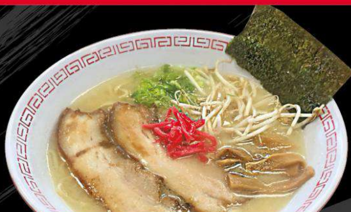
R2 TONKOTSU RAMEN $ 12.00 トンコツラーメン Pork sauce flavor