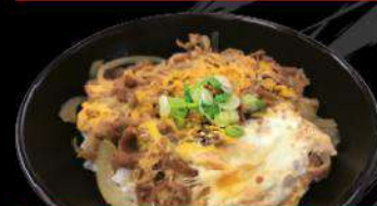
B5 GYU-TAMA-DON $13.50 牛玉丼 Gyu-don&onion with egg on rice