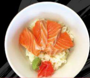
H2 HALF SIZE FRESH SALMON DON ハーフサーモン丼