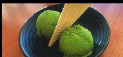
D1 GREEN TEA ICE CREAM 抹茶アイスクリーム G $ 5.00