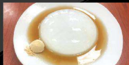
D5 RAIN DROP JELLY CAKE 水信玄餅 Served with soybean powder KINAKO and maple syrup $ 6.50