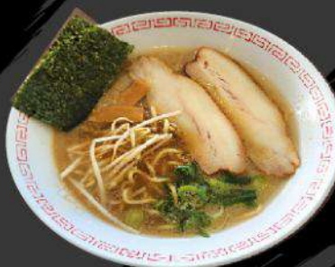
R6 SHOYU RAMEN $ 12.00 醤油ラーメン Soy sauce flavor