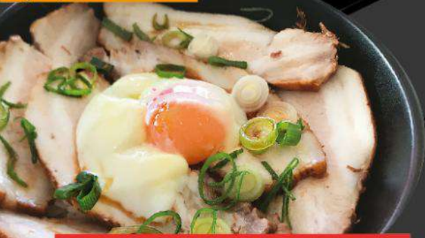
P3 CHA-SHU-DON $13.50 チャーシュー丼 Cha-shu pork and soft boiled egg on rice