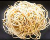
UP SIZE NOODLES 替え玉