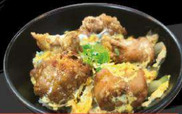
C3 KARA-AGE TOJI-DON $13.50 唐揚げとじ丼 Fried Chicken&onion with egg on rice