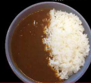
H1 HALF SIZE CURRY DON ハーフカレー丼