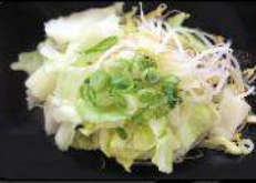
EXTRA VEGETABLE 野菜