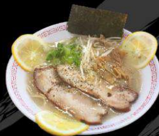
R11 LEMON RAMEN $ 13.00 レモンラーメン Fresh Lemon&Pork Flavor