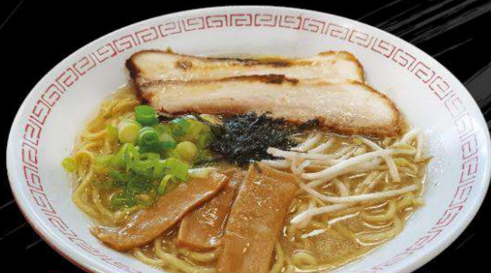
R1 SAMURAI RAMEN $ 12.00 とんこつ醤油ラーメン Pork & Soy sauce flavor