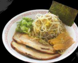
R10 MOYASHI RAMEN $ 15.50 もやしラーメン Miso flavor with bean sprouts topping