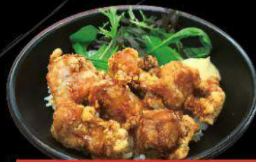
C2 KARA-AGE DON $13.50 唐揚げ丼 Fried chicken on rice