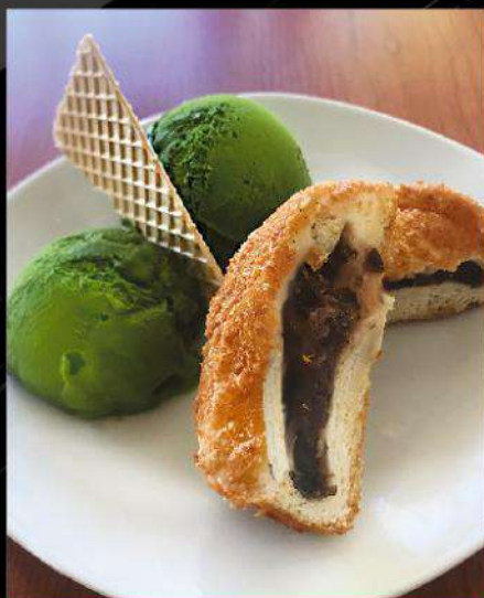
D3 SAMURAI DESSERT SET サムライデザートセット Green tea ice cream and sweet bean doughnuts $ 8.50