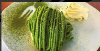
D4 GREEN TEA MONT BLANC 抹茶モンブラン Sponge cake base, with chest- nut & green tea cream icing $ 6.80