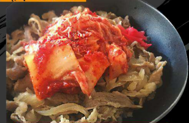
B2 KIMCHI GYU-DON $13.50 キムチ牛丼 Gyu-don with spicy pickled vegetable on rice