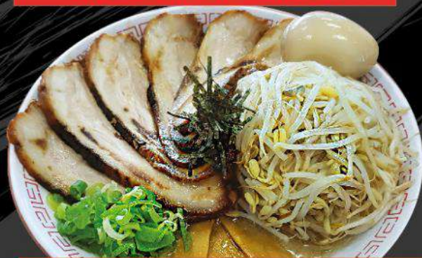
R5 ALL TOPPING SAMURAI RAMEN $ 19.80 全部のせラーメン/とんこつ醤油 Pork and soy sauce flavor soup. Extra bean sprouts, Extra Roasted pork&Ramen egg Topping