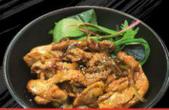
C1 TERIYAKI CHICKEN-DON $13.50 照り焼きチキン丼 Teriyaki chicken on rice