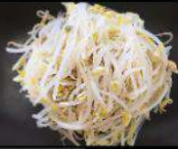
BEAN SPROUTS もやし