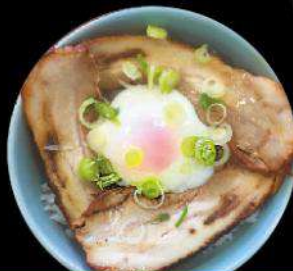
H4 HALF SIZE PORK CHA-SHU DON ハーフチャーシュー丼