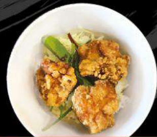
H5 HALF SIZE CHICKEN KARA-AGE DON ハーフ唐揚げ丼