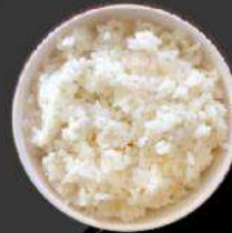
RICE ライス $ 2.80 Half size rice 半ライス $ 2.00