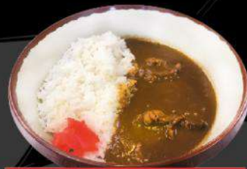
C5 CURRY-DON $12.50 カレー丼 Japanese style chicken curry on rice