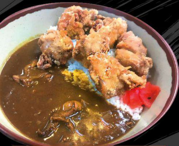
C4 KARA-AGE-CURRY $13.50 唐揚げカレー Golden fried crunchy chicken & Japanese style chicken curry on rice