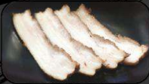
EXTRA ROASTED PORK チャーシュー+4P