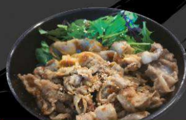
P2 TERIYAKI PORK GINGER-DON $13.50 豚生姜焼き丼 Our original Teriyaki pork ginger on rice