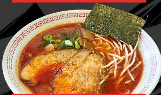
R4 SPICY MISO RAMEN $ 13.00 スパイシー味噌ラーメン Spicy Miso flavor