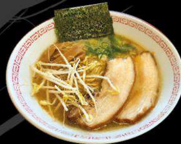
R7 MISO RAMEN $ 12.00 味噌ラーメン Miso flavor