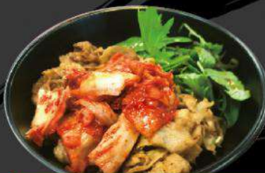
P1 BBQ PORK KIMCHI-DON $13.50 豚キムチ丼 Stir-fried pork with spicy Miso sauce and kimchi topping on rice