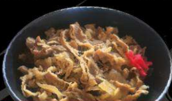
B1 GYU-DON $12.50 牛丼 Stewed beef in original soy sauce on rice