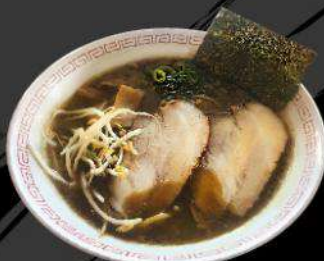
R9 CURRY RAMEN $ 13.00 カレーラーメン Curry flavor