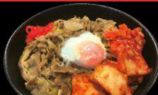
B4 ONTAMA KIMCHI GYU-DON $14.00 温玉キムチ牛丼 Gyu-don with soft boiled egg&kimchi topping