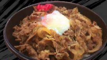
B3 ONTAMA GYU-DON $13.50 温玉牛丼 Gyu-don with soft boiled egg topping