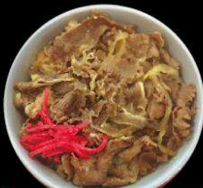
H3 HALF SIZE GYU DON ハーフ牛丼