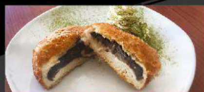
D3 SWEET AZUKI BEANS DOUGHNUT あずきドーナツ $ 4.00