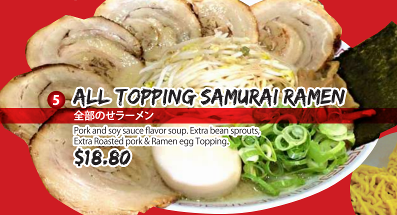
5 ALL TOPPING SAMURAI RAMEN 全部のセラーメン Pork and soy sauce flavor soup. Extra bean sprouts, Extra Roasted pork & Ramen egg Topping. $18.80