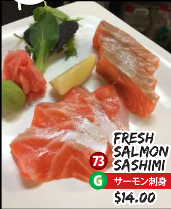
FRESH SALMON SASHIMI 73 G サーモン刺身 $14.00