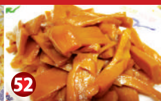
TASTY SPICY SPROUTS しゃきしゃきピリ辛もやし $5.50