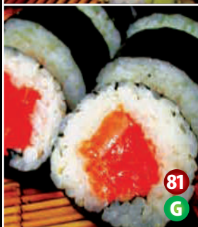
FRESH SALMON SUSHI 81 G サーモン寿司 8P/$9.80