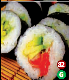
AVOCADO & FRESH SALMON SUSHI 82 G アボカドと サーモン寿司 8P/$9.80