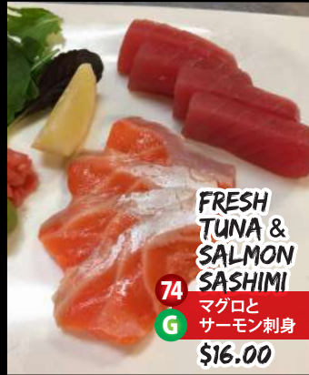
FRESH TUNA & SALMON SASHIMI 74 G マグロと サーモン刺身 $16.00