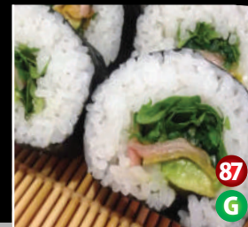
VEGETARIAN SUSHI ベジタリアン 寿司 8P/$9.80