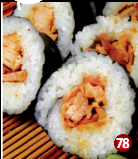
TERIYAKI CHICKEN SUSHI 照焼チキン寿司 78 8P/$9.80

Enjoy Samurai style fresh sushi come with Japanese wasabi mustard and pickled ginger slice.