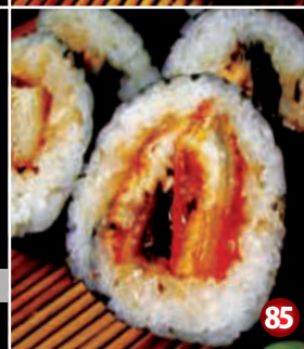
BBQ EEL SUSHI 85 鰻蒲焼寿司 8P/$10.80