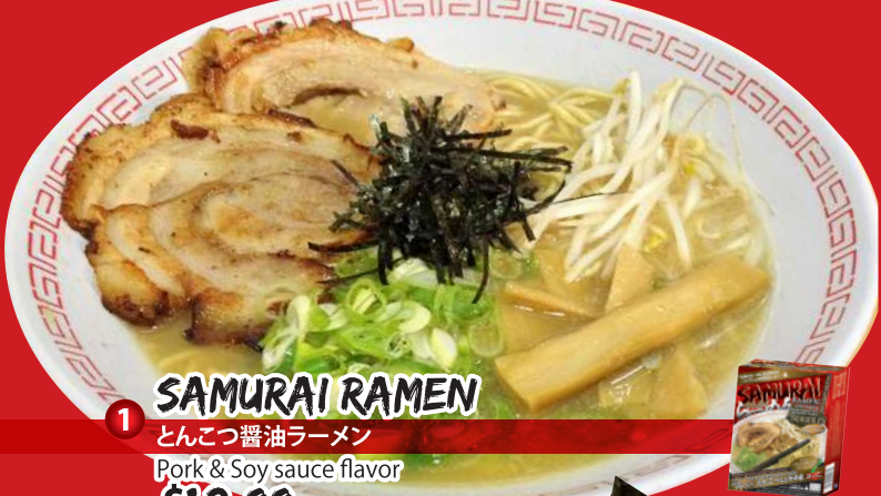
1 SAMURAI RAMEN とんこつ醤油ラーメン Pork & Soy sauce flavor $12.00