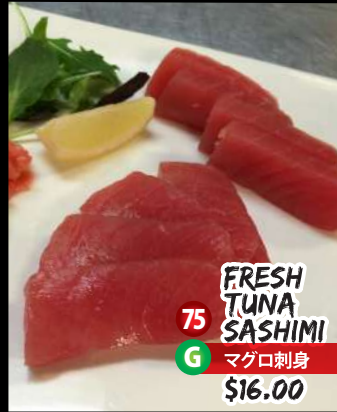
FRESH TUNA SASHIMI 75 G マグロ刺身 $16.00