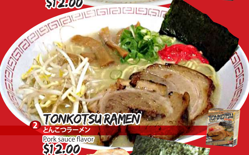
2 TONKOTSU RAMEN とんこつラーメン Pork sauce flavor $12.00