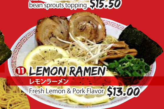
11 LEMON RAMEN レモンラーメン Fresh Lemon & Pork Flavor $13.00