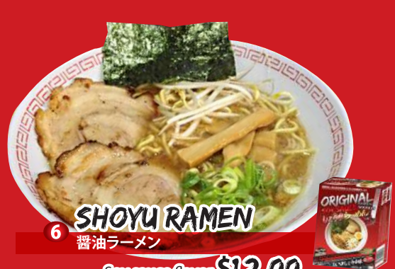
6 SHOYU RAMEN 醤油ラーメン Soy sauce flavor $12.00