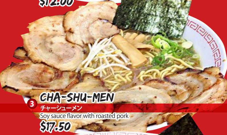
3 CHA-SHU-MEN チャーシューメン Soy sauce flavor with roasted pork $17.50