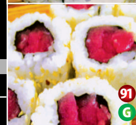
URAMAKI FRESH TUNA SUSHI 裏巻マグロ寿司 91 6P/$7.80