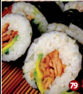
AVOCADO & TERIYAKI CHICKEN SUSHI アボカドと 照焼チキン寿司 79 8P/$9.80