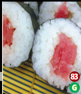
FRESH TUNA SUSHI 83 G マグロ寿司 8P/$10.80