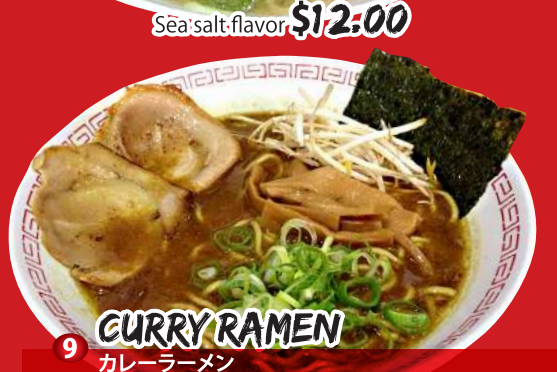
9 CURRY RAMEN カレーラーメン Curry flavor $13.00