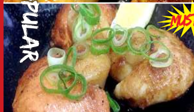
BUTTERED SCALLOPS ホタテバター Butter and soy sauce sautéed scallops $8.00