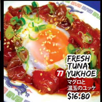
FRESH TUNA YUKHOE 77 マグロと 温玉のユッケ $16.80