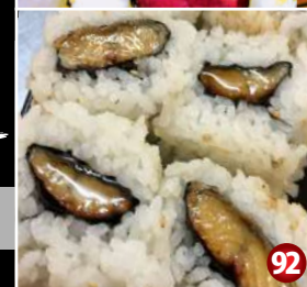
URAMAKI BBQ EEL SUSHI 裏巻鰻寿司 92 6P/$7.80

G Gluten free soy sauce and teriyaki sauce are available upon request. グルテンフリーのしょうゆまたはてりやきソースもご用意できます。