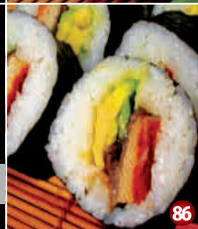
AVOCADO & BBQ EEL SUSHI 86 アボカドと 鰻蒲焼寿司 8P/$10.80