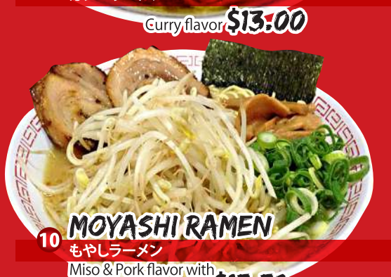
10 MOYASHI RAMEN もやしラーメン Miso & Pork flavor with bean sprouts topping $15.50