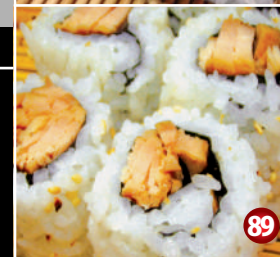
URAMAKI TERIYAKI CHICKEN SUSHI 裏巻 照焼チキン寿司 89 6P/$6.80