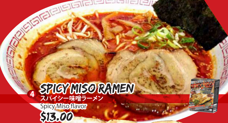
4 SPICY MISO RAMEN スパイシー味噌ラーメン Spicy Miso flavor $13.00