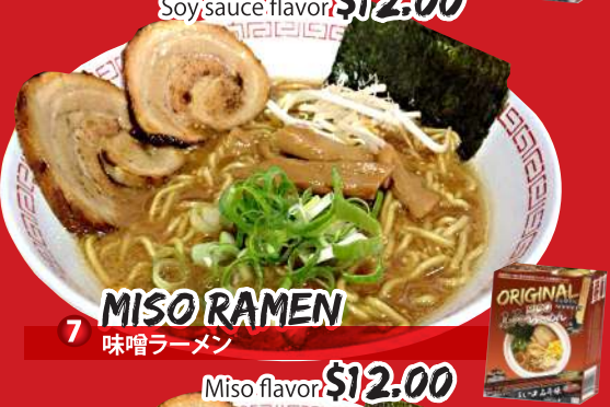
7 MISO RAMEN 味噌ラーメン Miso flavor $12.00