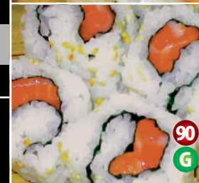
URAMAKI FRESH SALMON SUSHI 裏巻 サーモン寿司 90 6P/$6.80