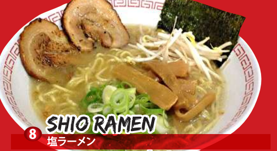
8 SHIO RAMEN 塩ラーメン Sea salt flavor $12.00