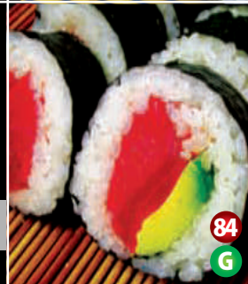
AVOCADO FRESH & TUNA SUSHI 84 G アボカドと マグロ寿司 8P/$10.80